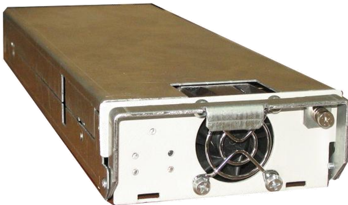
Рисунок 1.1 - Инвертор Штиль PS48-60/500К

Изделие пригодно для непрерывной круглосуточной работы без постоянного присутствия обслуживающего персонала.