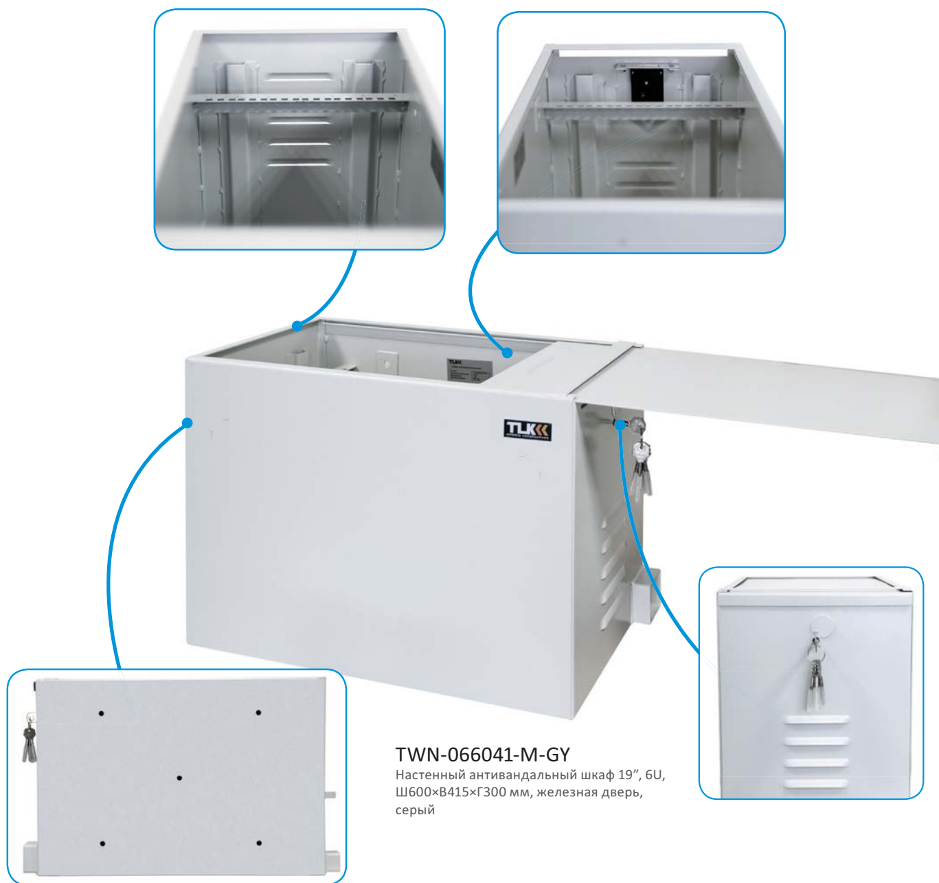
TWN-066041-M-GY Настенный антивандальный шкаф 19", 6U, Ш600×В415×Г300 мм, железная дверь, серый

Шкафы выполнены в 19" стандарте. Оборудование в шкаф устанавливается вертикально, параллельно боковым стенкам. Конструкция неразборная цельносварная. Все элементы шкафа изготовлены из 2 мм стали, а направляющие — из 1,5 мм стали. Сдвижная дверь-крышка снабжена замком повышенной секретности, в комплект входят 4 ключа. Для уста-